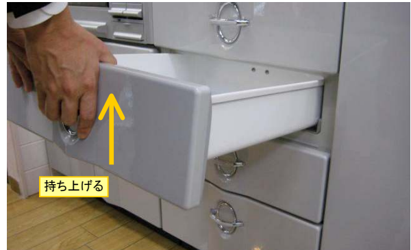
目一杯引き出した状態で、ゆっくり引出を持ち上げます。