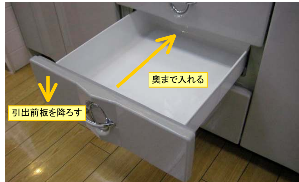
引出ストップバーが枠を超えたら、引出前板を降し、引出を奥まで入れます。