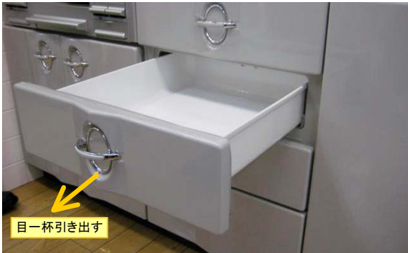
引出をゆっくり、止まるまで目一杯引き出します。