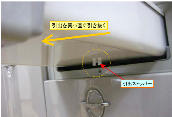
引出本体裏側の引出ストップバーが枠に当たらなくなります。引出を真っ直ぐに引き抜きます。