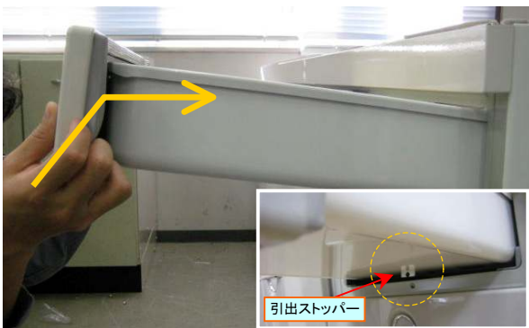
引出ストップバーが枠を超えるように、引出前板を持ち上げながら引出を入れます。