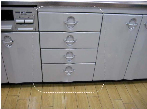
※引出前板は調整出来ません。